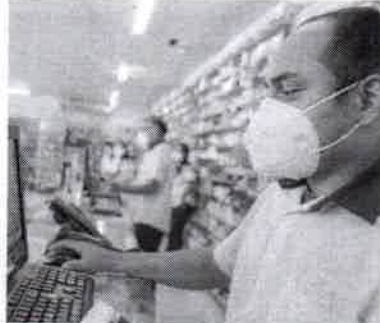
REAJUSTE no preço dos medicamentos influencia alta do IPCA-15

A alta no preço dos medicamentos puxou a prévia da inflação de maio em Fortaleza, que ficou em 0,61%, segundo o Índice Nacional de Preços ao Consumidor Amplo 15 (IPCA-15) divulgado ontem pelo Instituto Brasileiro de Geografia e Estatística (IBGE).